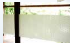
透明感ある窓ごこち

(大) 本体サイズ/W900×H300mm、外装/W255×H380mm、枚数/2枚入 (小) サイズ W900×H150mm、外装/W145×H240mm、枚数/2枚入