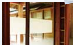
ちょっと目線かくし